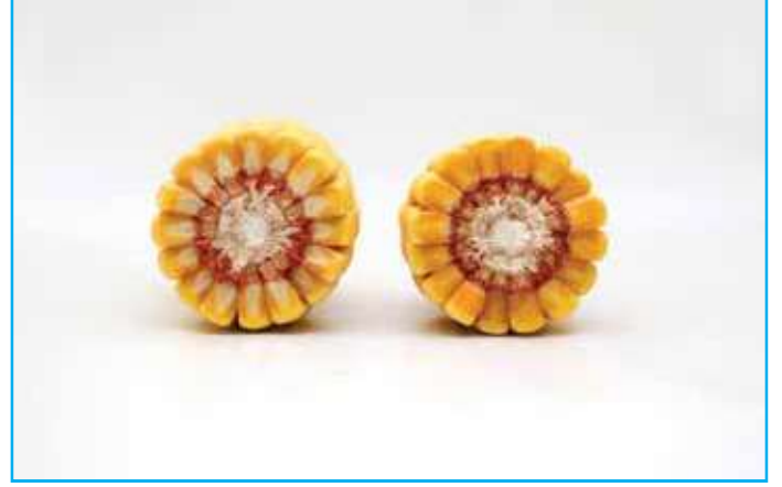
Koçan enine 16, uzunluğuna 38-42 sıralıdır